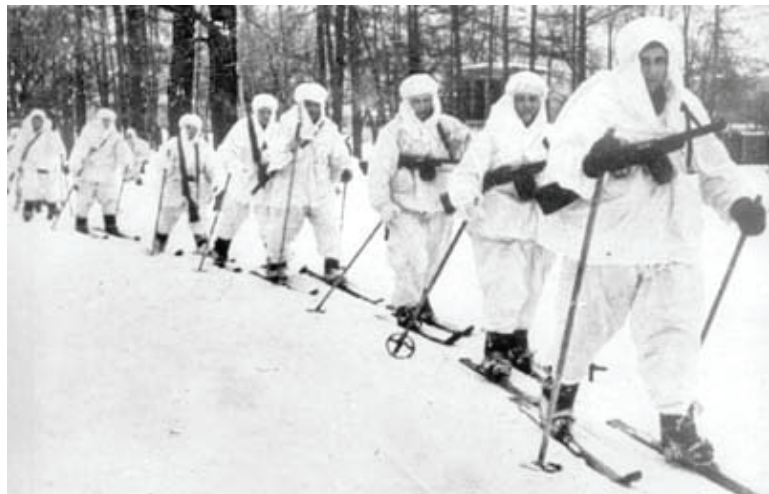
Лыжня в бессмертие. Отряд героически погиб, но приказ выполнил.

Я сейчас думаю, что беда была в том, что нас не поддерживали остатки пехотных подразделений, находившихся рядом, они-то должны были наносить